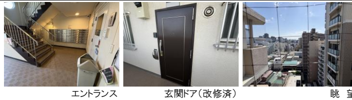
エントランス 玄関ドア(改修済) 眺望

※図面の間取・方位・仕様は現況優先となります。※司法書士は売主指定の司法書士となります。