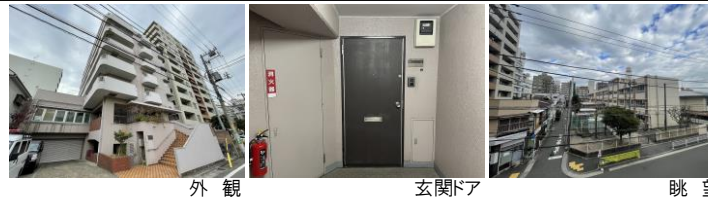
外観 玄関ドア 眺望