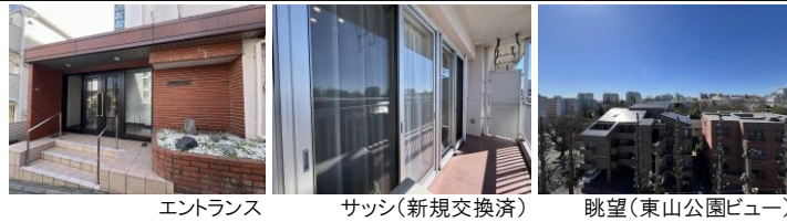
エントランス サッシ(新規交換済) 眺望(東山公園ビュー)